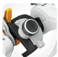
Prow. wyr. kłykciowych regulacja kąta Bennetta