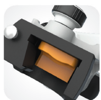
Zakrzywione prowadnice wyr. kłykciowych