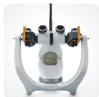
Szeroki kąt widoczności