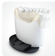
Płytkę montażową z prowadnicą