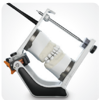
Kąt nachylenia 45°