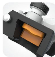
Zakrzywione prowadnice wyr. kłykciowych