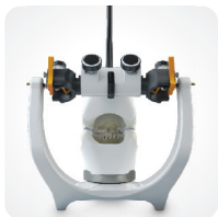
Szeroki kąt widoczności