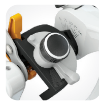
Prow. wyr. kłykciowych regulacja kąta Bennetta