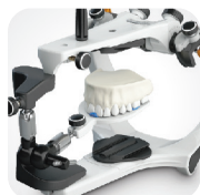
Statyw do transferów