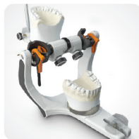
Kąt otwarcia 180°